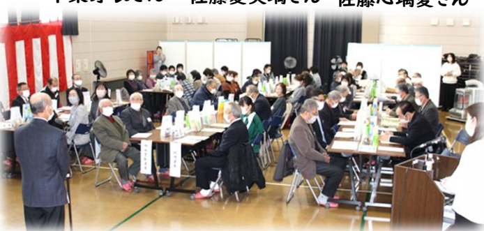
▲6年錦織新春のつどい会場の様子