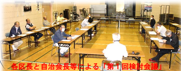
各区長と自治会長等による「第1回検討会議」〔6月25日／公民館「軽運動場」〕

【留意】錦織出前タクシーを利用するには会員登録が必要。個人で年／千円。1世帯〔3人以上〕年／三千元。利用できる行先は自宅から73拠点（町内）と中田町1拠点（ウジエスーパー）のみ。（現時点）