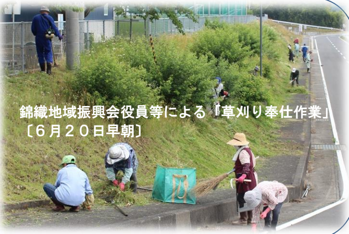
錦織地域振興会役員等による「草刈り奉仕作業」 〔6月20日早朝〕

錦織地域振興会役員等による草刈り奉仕作業が6月20日〔土〕の朝6時から約2時間実施。東和総合運動公園内の市道法面や第2駐車場法面を女性4名を含む14名が草刈り機械や鎌等を持参で参加。刈った後の草等を片付け、見違えるようになりました。役員等の皆さんご苦労様でした。同作業は、5年程前から振興会の収入不足を補う目的で、運動公園指定管理料から支出される経費を事業収入として対応しています。2回目は9月5日（土）を予定しています。