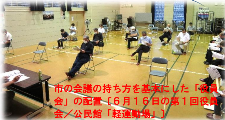
市の会議の持ち方を基本にした「役員会」の配置〔6月16日の第1回役員会／公民館「軽運動場」〕

【3】町内三公民館指定管理者連携会議〔6月10日開催〕に市の担当課長等を招いての内容を報告。その中で「市民運動会の開催有無は、現段階の基本ガイドラインをクリアすれば、開催は不可能ではない」旨の回答を受けて当役員会で協議した結果、意思決定は、後日、再度役員会で協議することになりました。