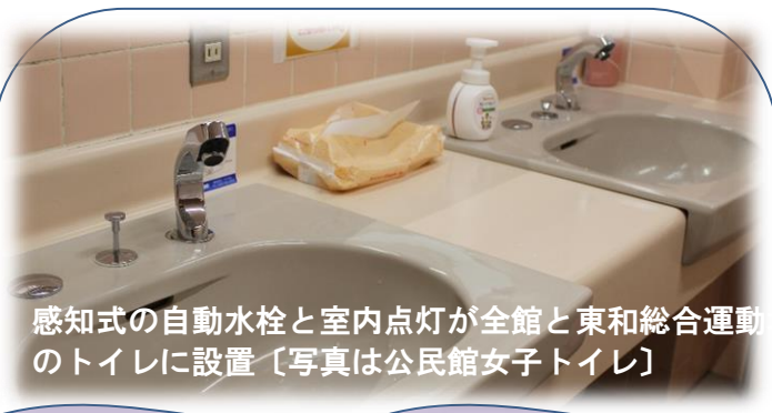
感知式の自動水栓と室内点灯が全館と東和総合運動公園内のトイレに設置〔写真は公民館女子トイレ〕

【東和町の人口=6,093人/米谷=2,355人/米川=2,190人/錦織=1,499人】※令和2年3月末日現在