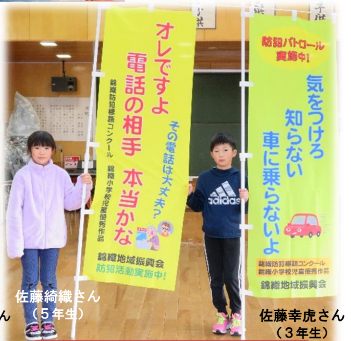
防犯のぼり旗標語【優秀作品】