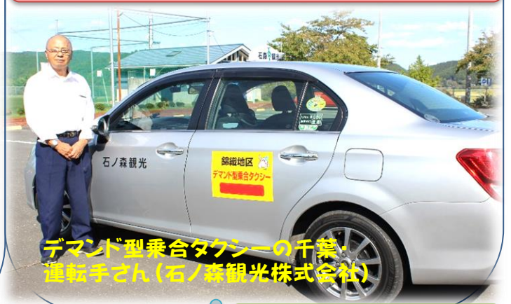
デマンド型乗合タクシーの千葉運転手さん(石ノ森観光株式会社)