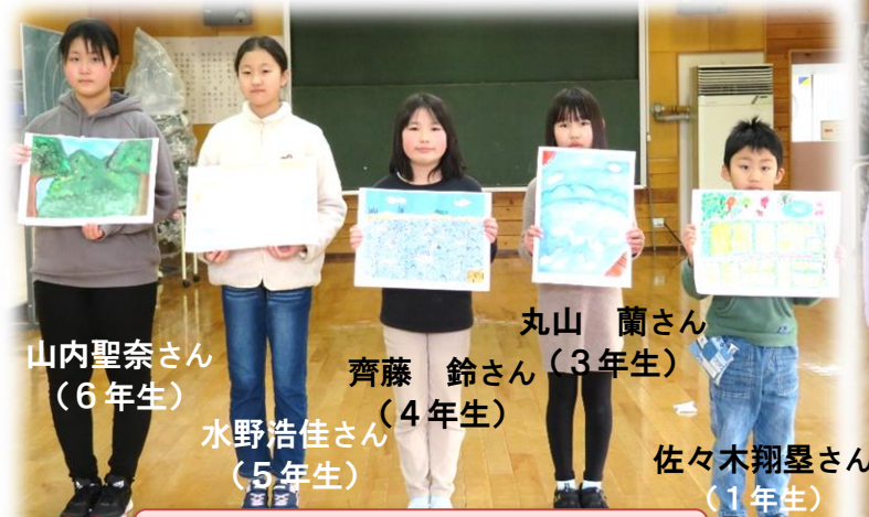
児童画コンクール【優秀作品】