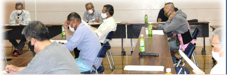
役員会の様子〔5月26日／公民館・軽運動場〕

地域のコミュニティ組織である「錦織地域振興会」の大事な総会の意義をご理解のうえご協力をお願いいたします。