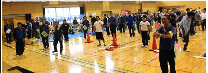
▲室内での運動会となりました〔開会式から〕

※市民運動会に、多くの商店・事業所等から「副賞」を頂きました。深くお礼を申し上げます。また、前日の準備や当日の大会運営に携わって頂いた実行委員〔スタッフ等〕の皆さん、本当にありがとうございました。