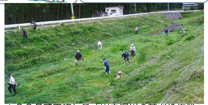
▲22名で実施した「岩之沢川の草刈り作業」 ※12月号は6区の特派員です。輪番制です。