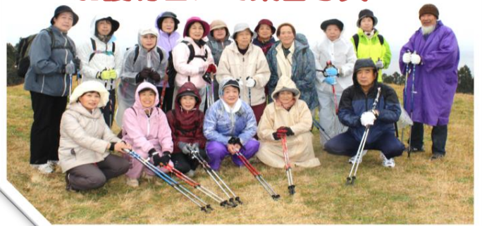
▲加護坊山からスタート/先ず記念撮影