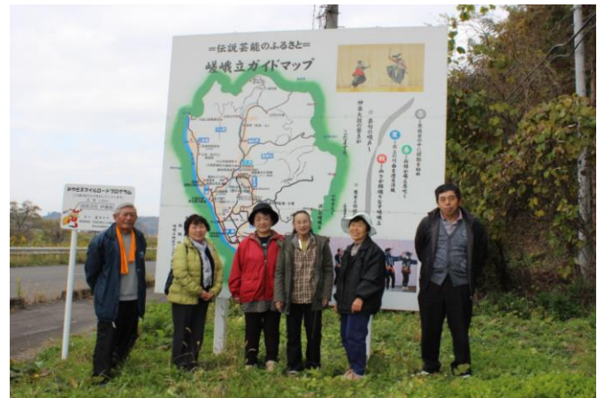
▲「錦織地域探訪」参加者の皆さん (嵯峨立ガイドマップ看板前で)

錦織地域振興会・錦織公民館主催の『錦織地域探訪』が11月11日に実施しました。これは平成25年度に策定した「錦織地域づくり計画25」の計画書に基づいて、地域の新たな発見を模索しようと、地域振興部会の「お宝発掘事業」と芸能・文化部会の「錦織八景設置看板巡視事業」を合同で実施したもので、両部会員7名が参加。錦織地区内を午前中かけて視察しましたが、今後の事業計画及び事業推進に役立つものと確信しました。