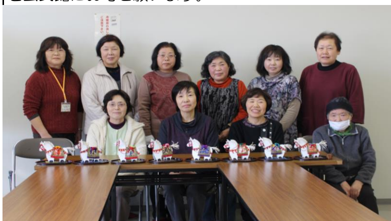
△閉講式で作品を前に「記念撮影」

全4回の回数で開催した手芸講座が大好評で、公民館まつりにも出展を協力いただいた「壁掛けお雛様」と、その後に「干支の午づくり」を作りました（2作品とも和紙での折り紙）が、途中から受講したいとの申込みもあり、人気は上々。受講生は10名が限度でしたが「今後は、季節に合わせた手芸講座を設けてほしい」との要望もありました。気軽にご意見・情報等を公民館にお寄せ願います。