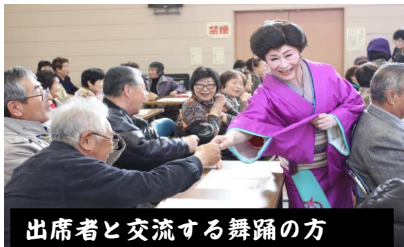
出席者と交流する舞踊の方

錦織地域の概ね60歳以上の方々を対象にした「錦織長生大学第6回学習会と閉講式」が、2月24日〔火〕午前10時から錦織公民館で開かれました。第1部は「股旅・マドロス演歌舞踊」12曲を鑑賞。第2部は「閉講式」が行われ、年間6回の学習会で3回以上の方に「寿証書と記念品が授与」されました。その後、昼食を食べながら「嵯峨立和やか会」と「錦寿会」〔各老人会〕からのアトラクション・余興が披露され、約70名の出席者は「楽しかった」と満足した様子でした。