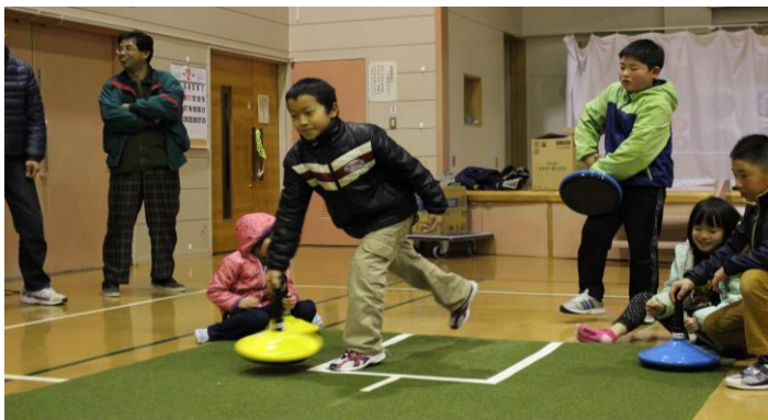
▲ユニカールを楽しむ小学生の参加者

冬期間の健康づくりと錦織地域の方々の交流・親睦を目的とした「錦織ユニカール大会」が2月14日に開催され、小学生含め20名が参加。優勝は浅草チームで準優勝は入沢チームでした。