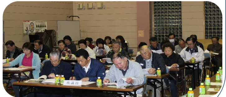
▲昨年の総会様子「軽運動場」

※総会は「代議員総会」です。各自治会及び関係団体は2名の代議員を選出願います。〔後日代表等に関係資料を送付いたします。多くの方にご出席を賜りますようお願いいたします。〕